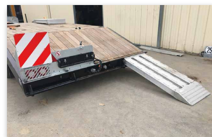
Rampe amovible aluminium