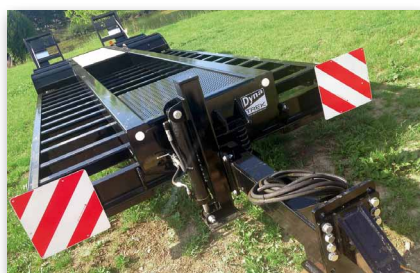
Béquille hydraulique – attelage réglable en hauteur de série

* Roues jumelées en standard / Roues pleines non jumelées en option