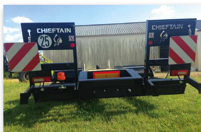
Plaques rouge et blanche + gyrophare