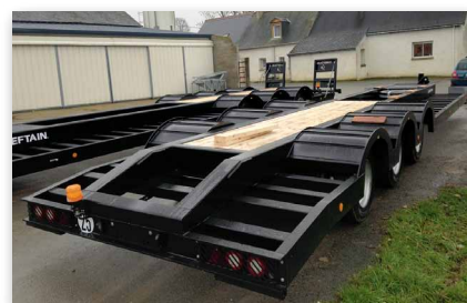
Pan cassé pour rampes alu