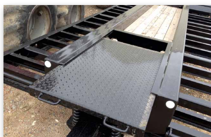
Coffre de rangement