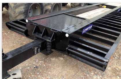
Flèche sur ressort